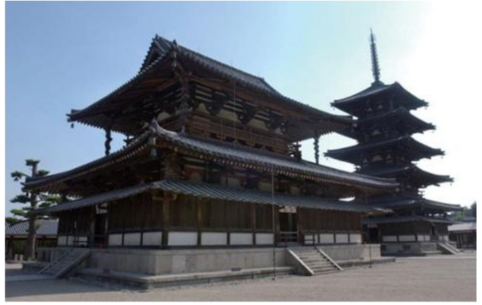
(写真左) 国宝 中門 飛鳥時代 (写真右) 国宝 金堂 飛鳥時代 (左) と国宝 五重塔 飛鳥時代 (右)